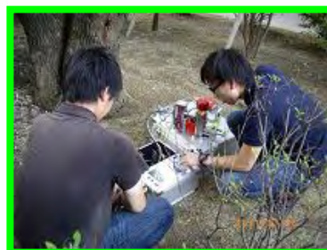
摂南大学でのフィールド試験